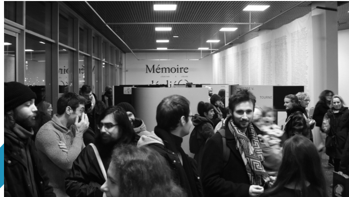
Vernissage de l'exposition Mémoire déplié(e), l'écriture à l'œuvre, novembre 2023.