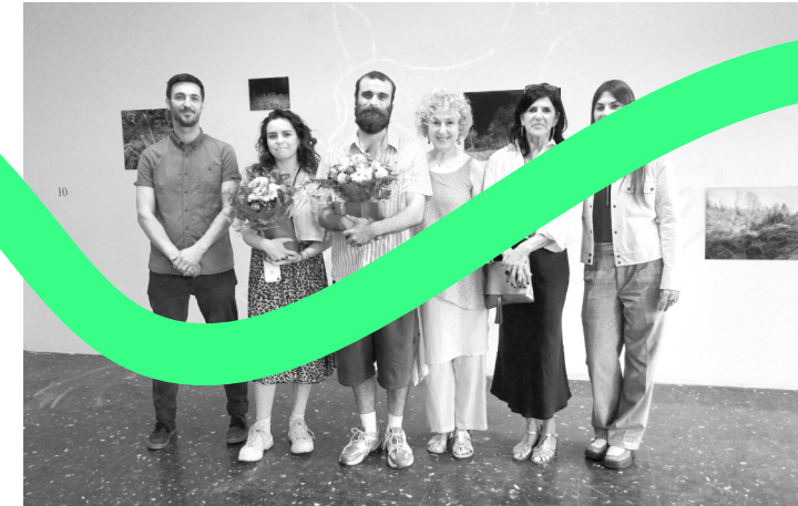
Diplômés du DNSEP/Master, lauréats du prix Point d'Or et du Coup de cœur Bliiida, juin 2023